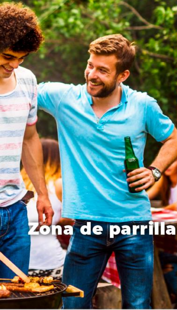
Zona de parrilla