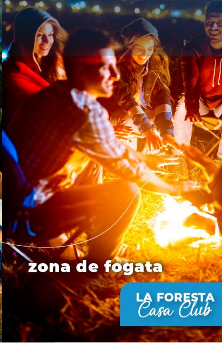
zona de fogata