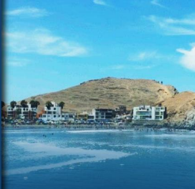
◆ BALNEARIO DE CERRO AZUL