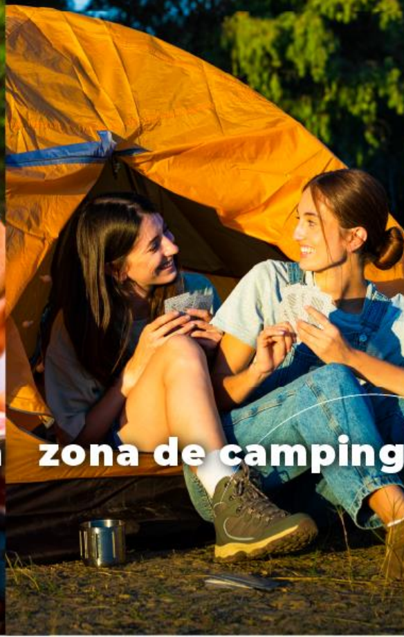
zona de camping