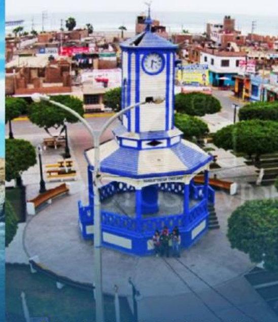
◆ PLAZA DE CERRO AZUL